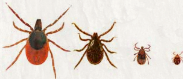
Tiques adultes, nymphe à huit pattes et larve à six pattes