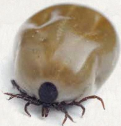
Ixodes ricinus (femelle) remplie de sang

Il existe dans le monde plus de 900 espèces de tiques différentes. Les tiques de la famille des ixodes (ou tiques dures) sont présentes dans toute l'Europe centrale et leurs piqûres peuvent provoquer diverses maladies, comme la maladie de Lyme et la MET. L'une des principales causes de propagation des maladies transmises par les tiques est l' ixodes ricinus , mieux connue sous le nom de « tique du mouton ».