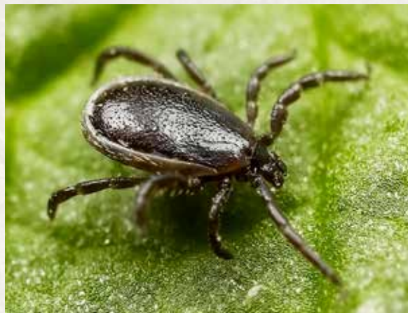
Ixodes ricinus (männlich)

Les larves repues sur un animal se laissent tomber au sol et se transforment en nymphe. Ces nymphes attendent de nouveau un animal, qu'elles infestent, se nourrissent, se laissent tomber au sol, puis muent en tique adulte. Ces tiques se fixent alors sur un troisième hôte. Une tique femelle repue ou remplie de sang produit une seule grande quantité d'oeufs, puis meurt. Selon l'espèce de tique, la quantité d'oeufs varie entre 1000 et 18 000.