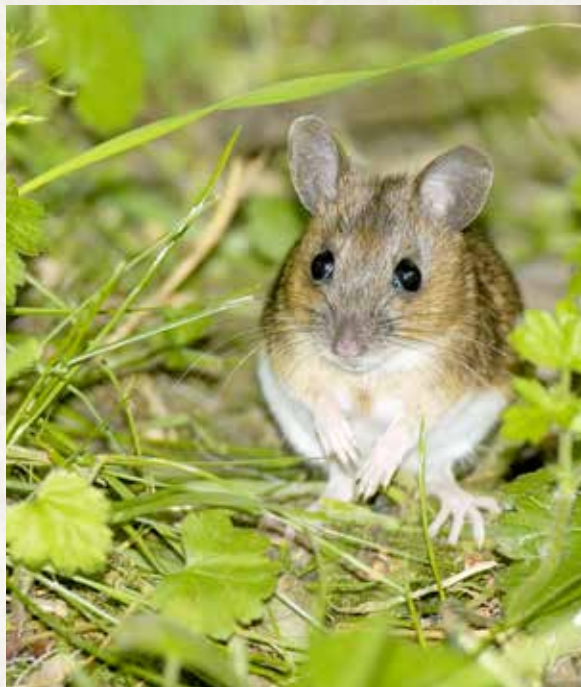
Mulot ( apodemus sylvaticus )

Les Anti-Tiques Système de Protection n'attirent pas les petits mammifères dans les jardins. Seuls les petits mammifères qui se trouvent déjà sur votre terrain deviendront vos alliées dans la lutte contre les tiques.