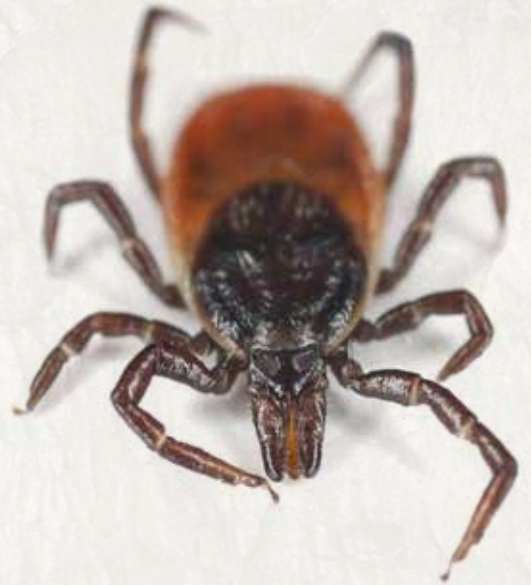
Ixodes ricinus (weiblich)

Les tiques sont des acariens. Elles doivent se nourrir de sang et donc infester des animaux (hôtes). Les tiques ont un cycle de vie complexe : oeuf, larve à six pattes, nymphe à huit pattes et tique adulte (mâle ou femelle). Les larves et les nymphes passent au stade de croissance suivant, où elles muent, après une période où elles se nourrissent de sang.